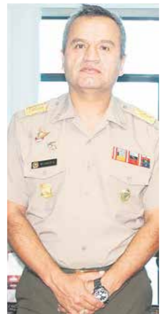
General Oswaldo Calle Talledo, jefe del Estado Mayor del Ejército. Según la Contraloría, también participó en la dirección para favor de Milenium Veladi Corp.

Jorge Chávez Cresta: exministro de Defensa de Dina Boluarte. El negociado de los helicópteros rusos ocurrió durante su gestión.